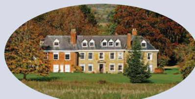
Ladbroke Hall from viewpoint