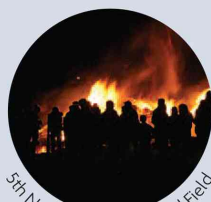
5th November on Farmyard Field