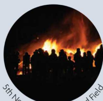
5th November on Farmyard Field