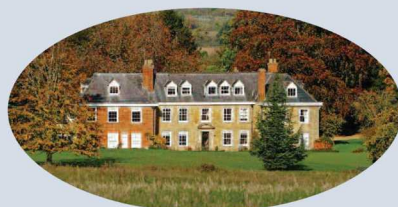
Ladbroke Hall from viewpoint